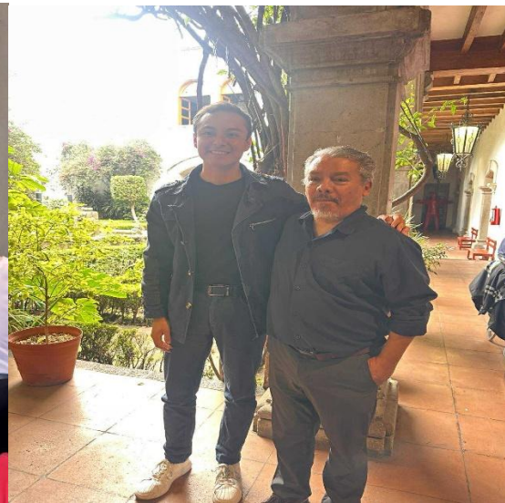
Macaya 111, Col. San Marcos C.P. 2020, Alcaldía Azcapotzalco, Ciudad de México.